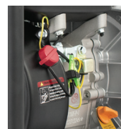
Sensor de aceite