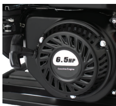
Retractable Fácil encendido