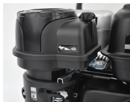
Filtro a prueba de AGUA