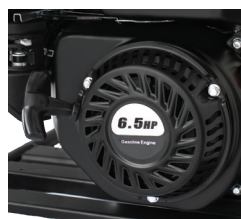
Retractable Facil encendido